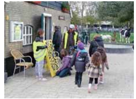
emmers en moppen tevoorschijn gehaald om de

springkussens droog te maken. De bezoekerjes verlieten hun schuilplaatsen en speelden vrolijk verder. Vandaag waren er, waarschijnlijk omdat dit een zeer bijzondere dag was, vier fotografen aanwezig. En dat is maar goed ook want zo zijn