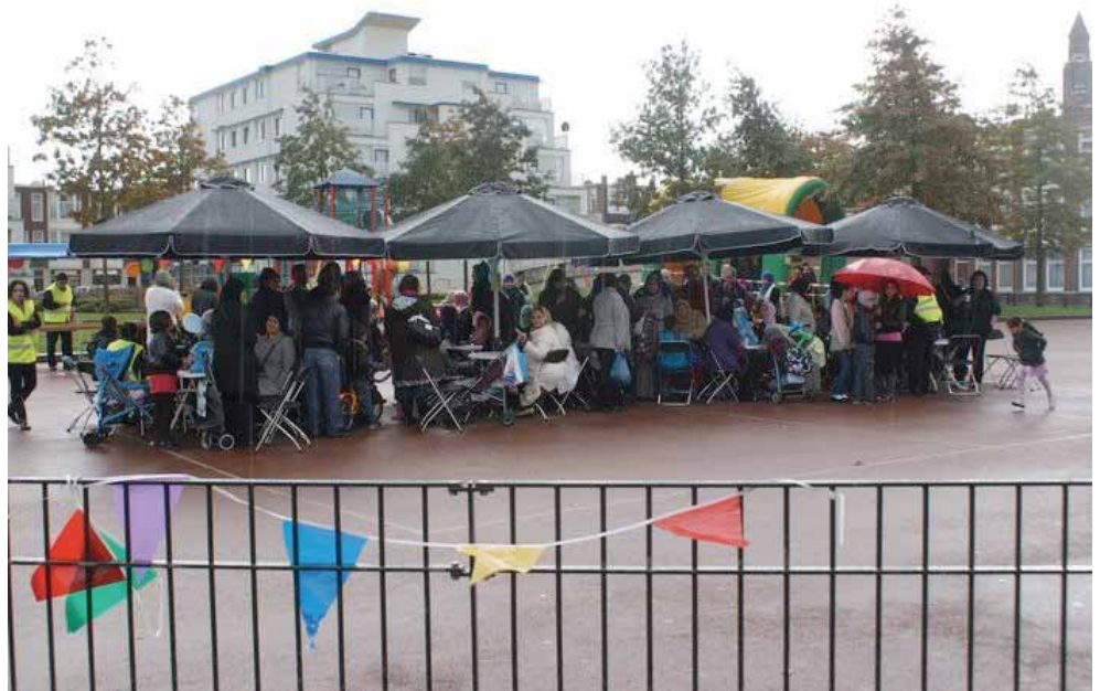
Terras met regen!

De hagel die genadeloos en pijnlijk in hun gezichtjes beukte was voor de meesten reden om toch maar naar huis te gaan. Echter niet de "diehards". De aller-trouwste Hopjes kinderen. Zij bleven en vermaakten zich tussen het schuilen door. Zo ook de vrijwilligers van de Haagse Hopjes.